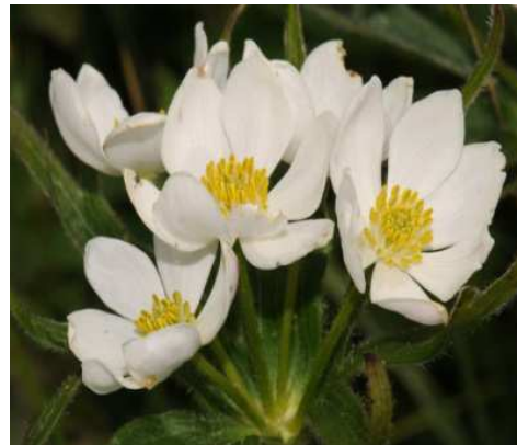
Anémone des forêts

Nom : Primula Famille : Primulacées Type : Vivace Floraison : octobre à avril ou février à septembre Hauteur : 10 à 50 cm selon espèces Exposition : Ensoleillée, mi-ombre et ombre Sol : Plutôt riche, bien drainé et frais