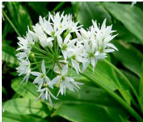
Ail des ours

Nom : Fragaria vesca Famille : Rosacées Type : Vivace Floraison : avril à octobre Hauteur : 30 cm Exposition : mi-ombre, soleil Sol : Ordinaire