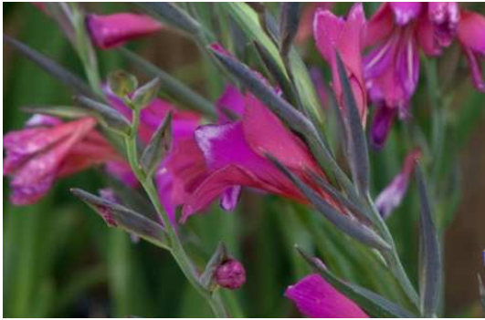
Glaieul de Byzance

Nom : Gladiolus byzantinus Famille : Iridacées Type : Blube Floraison : Mai à juin Hauteur : 70 cm Exposition : Ensoleillée Sol : Frais