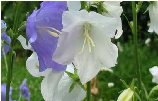
Campanule de Perse

Nom : Centaurea montana Famille : Asteracées Type : Vivace Floraison : Mai à juillet Hauteur : 50 cm Exposition : Ensoleillée Sol : Ordinaire