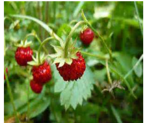
Fraisier des bois

Nom : Anemone sylvestris Famille : Renonculacées Type : Vivace Floraison : avril à juin Hauteur : 50 cm Exposition : mi-ombre, soleil Sol : Ordinaire