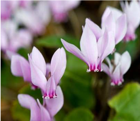
Cyclamen de Naples

Nom : Cyclamen neapolitum Famille : Primulacées Type : Bulbe Floraison : Août à octobre Hauteur : 10 à 15 cm Exposition : Mi-ombre, sous-bois Sol : Léger et bien drainé