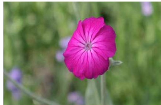
Coquelourde des jardins

Nom : Malva sylvestris Famille : Malvacées Type : Vivace Floraison : Juin à septembre Hauteur : 50 cm Exposition : Ensoleillée Sol : Ordinaire