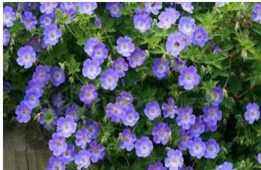
Géranium vivace 'Rozanne'

Nom : Lathyrus latifolius Famille : Fabacées Type : Fleur, vivace Floraison : Juin à septembre Hauteur : 2 m Exposition : Mi-ombre, soleil Sol : Drainant