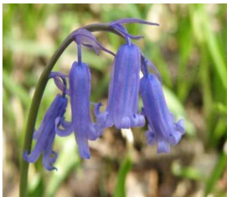
Jacinthe des bois

Nom : Galanthus Famille : Alliées Type : Bulbe de printemps Floraison : Janvier à mars Hauteur : 15/20 cm Exposition : Ensoleillée Sol : Ordinaire