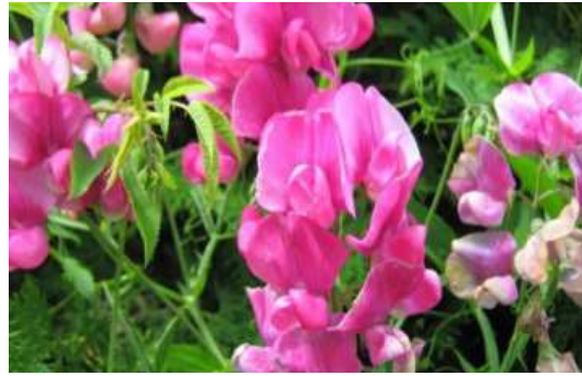
Pois de senteur vivace

Nom : Hedera helix Famille : Araliacées Type : Grim pant Floraison : Janvier à décembre Hauteur : 5 à 20 m Exposition : Ensoleillée, mi-ombre et ombre Sol : Ordinaire