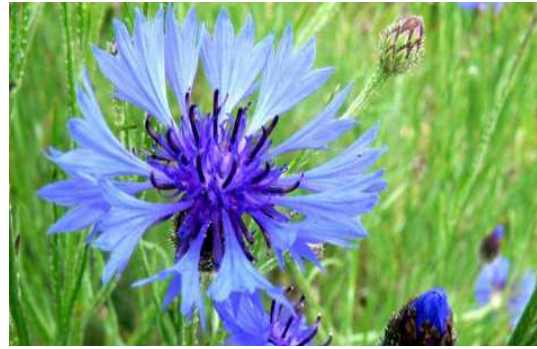
Bleuet des montagnes

Nom : Scabiosa columbaria Famille : Dipsacacées Type : Vivace Floraison : Juin à octobre Hauteur : 30 cm Exposition : Ensoleillée Sol : Ordinaire