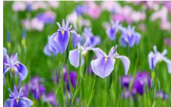
Iris des jardins

Nom : Campanula persicifolia Famille : Campanulacées Type : Vivace Floraison : Juin à août Hauteur : 80 cm Exposition : Mi-ombre, soleil Sol : Ordinaire